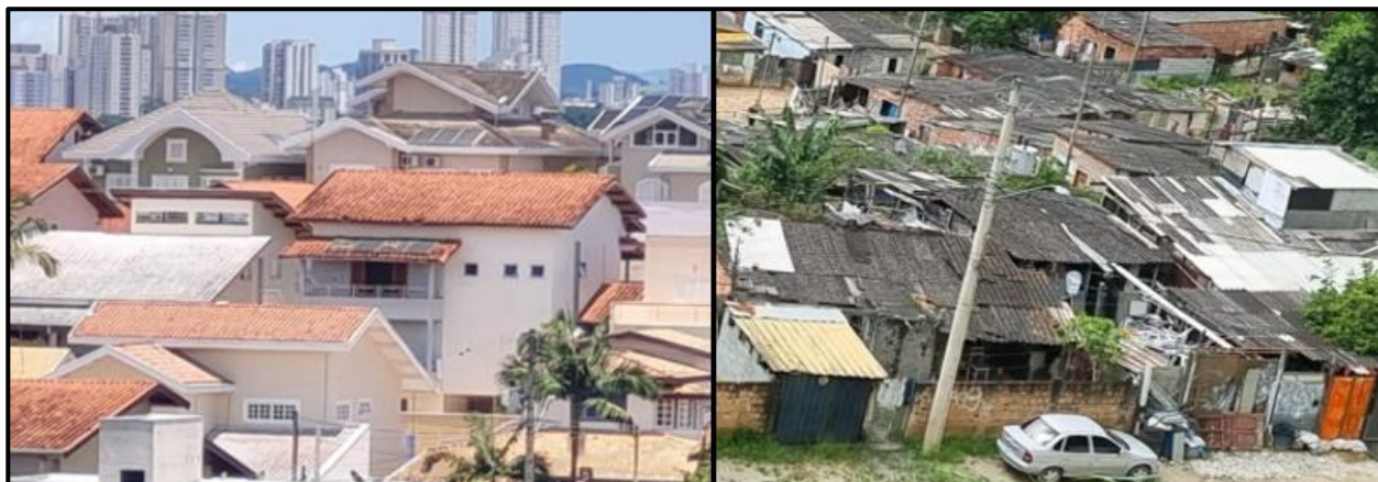
Figura 03: Antagonismo do Bairro Urbanova e a Favela Jardim Nova Esperança